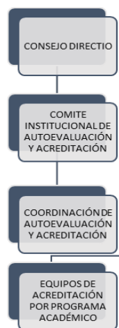
Figura 1. Estructura Organizacional

Estructura organizacional que se dispone para el proceso está conformado por: un Comité Institucional de Autoevaluación, Coordinación de Autoevaluación y equipos de acreditación por programa liderado por su Docente de apoyo.