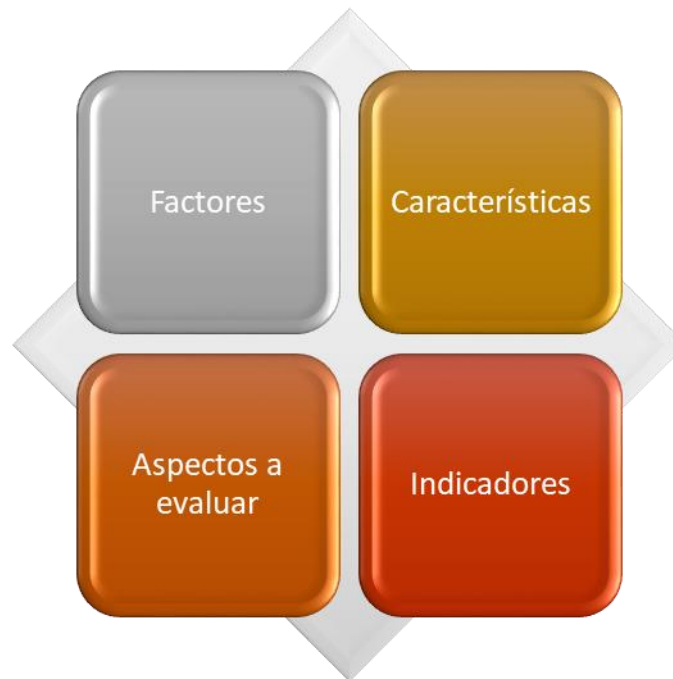
Figura 2. Modelo de Autoevaluación