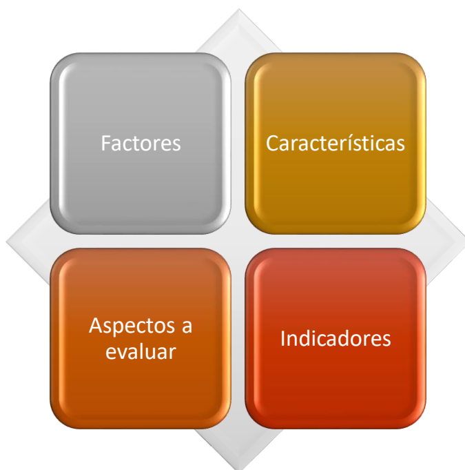
Figura 2. Modelo de Autoevaluación

La evaluación de la calidad del Instituto Tecnológico del Putumayo y de sus programas académicos se centrará en el análisis, validación de los factores y características recomendados por los Lineamientos del Consejo Nacional de Acreditación, que a continuación se describen: