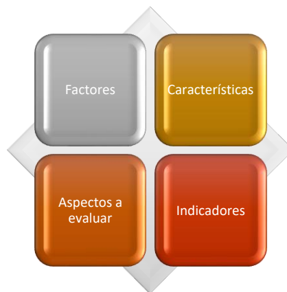
Figura 2. Elementos Constitutivos del Sistema de Autoevaluación.