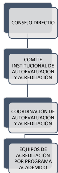
Figura 1. Estructura Organizacional Autoevaluación Instituto Tecnológico del Putumayo