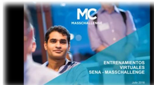
Figura 6. Unidad de emprendimiento ITP

Alianza ITP-Sena-Fondo Emprender: desde la Unidad de Emprendimiento ItpEmprende se apoyó a 12 docentes adscritos a los programas de administración de empresas y contaduría, como también a egresados en el proceso de formación en transferencia metodológica del Centro de Desarrollo Empresarial SBDC Regional Putumayo, donde se espera que con esta estrategia fortalecer y llegar a más emprendimientos del departamento.