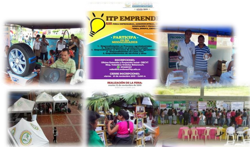
Figura 5. Feria de emprendimiento ITP

procesos investigativos, mediante la socialización y desarrollo de experiencias exitosas, iniciativas productivas y proyectos innovadores, elaborados en el quehacer académico con base en las diferentes líneas de investigación.