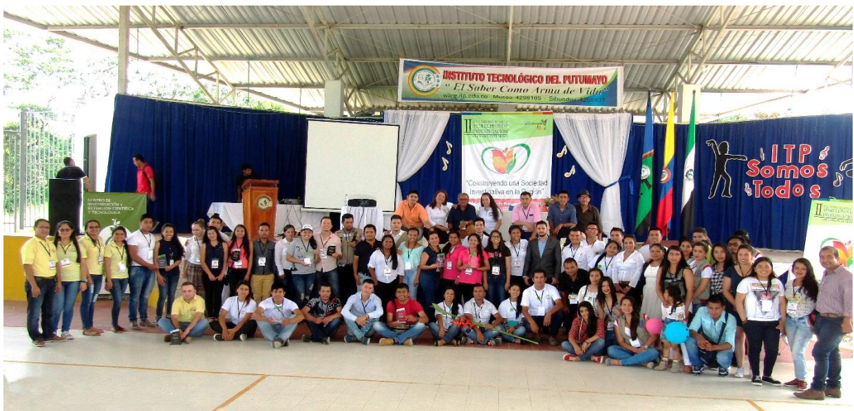
Figura 1: II Encuentro de Semillero de Investigación en el Instituto Tecnológico del Putumayo

El III Encuentro Regional de Semilleros de Investigación se realizará los días 21 y 22 de mayo del 2018 y tendrá como sede el INSTITUTO TECNOLÓGICO DEL PUTUMAYO, Sede Mocoa: “Aire Libre” Paraje B/ Luis Carlos Galán – 4296105