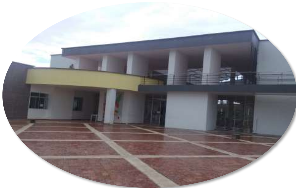
Foto1: Sede Pabellón de Laboratorios Instituto Tecnológico del Putumayo

El Encuentro Regional de Semilleros de Investigación se realizará los días 7 y 8 de Octubre de 2016 y tendrá como sede el INSTITUTO TECNOLÓGICO DEL PUTUMAYO, Sede Mocoa: “Aire Libre” Paraje B/ Luis Carlos Galán – ☎ 4296105